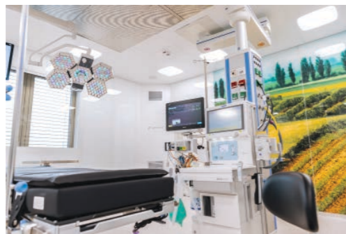
OPERACIJSKE SALE NALAZE SE ODMAH DO ODJELA STACIONARA, ŠTO OLAKŠAVA TRANSPORT PACIJENATA